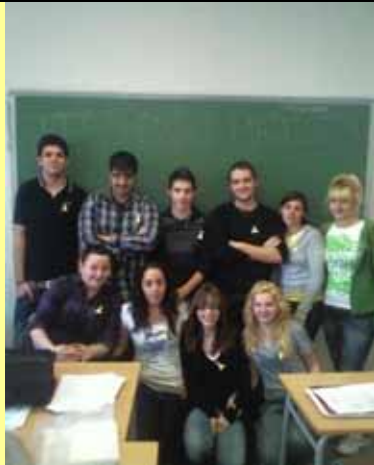
COLLA DE XARAMITERS LA XARAMITA CANA (NOVELDA)