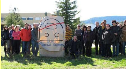
IES Pare Arques de Cocentaina