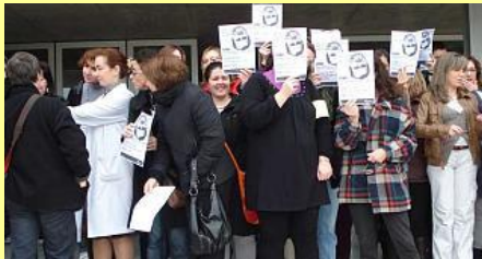
IES Lloixa de Sant Joan