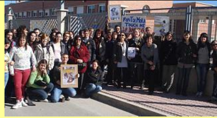
IES Callosa d'En Sarrià