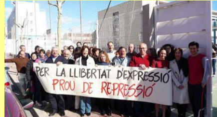
IES Gaia (Sant V. del Raspeig)