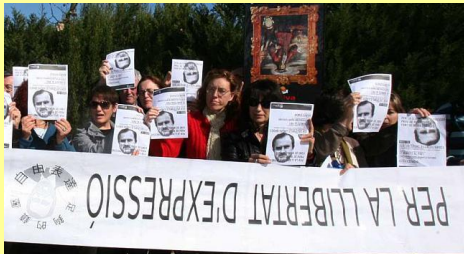
IES Enric Valor (Campello)