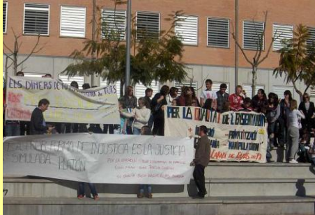
IES L'Arabi de L'Alfàs del Pi