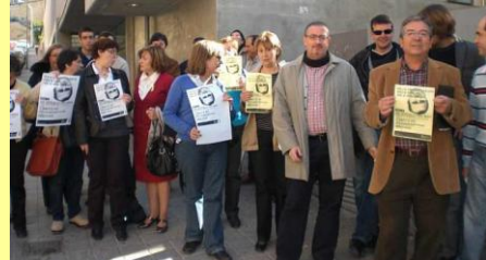
IES Miguel Hernández (Alacant)