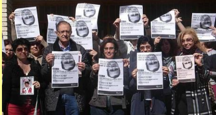
IES Bahía de Babel (Alacant)