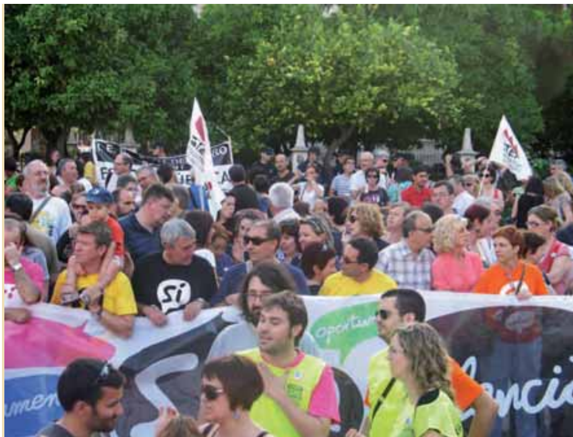
Manifestació de la Plataforma de l'ensenyament públic a València, el 18 de juny (GRÀCIA ÀUSIAS)

Sabem que la conselleria d'Educació no desconeix el resultat de les avaluacions dels programes que s'han realitzat en el nostre sistema educatiu, com ara la de Domènech i Zornoza (1996) i les dues de l'Institut Valencià d'Avaluació i Qualitat Educativa (IVAQUE/IVECE): l'una (2000), de 1228 alumnes de 4t d'ESO, i l'altra (2004) de l'alumnat d'educació infantil de 14 centres Programa d'Educació Bilingüe Enriquit (PEBE). En totes ha quedat patent la superioritat del Programa d'ensenyament en valencià i del Programa d'Immersion Lingüística sobre el Programa d'incorporació progressiva i han posat de manifest que el valencià no és un problema en els estudis de l'alumnat sinó, més aviat, la condició necessària per a l'excel·lència.