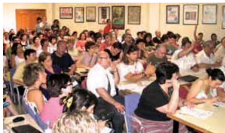
Participació massiva en les assemblees informatives sobre el procediment telemàtic d'adjudicacions

Els canvis en la Conselleria retarden la decisió amb les adjudicacions de mestres en marxa