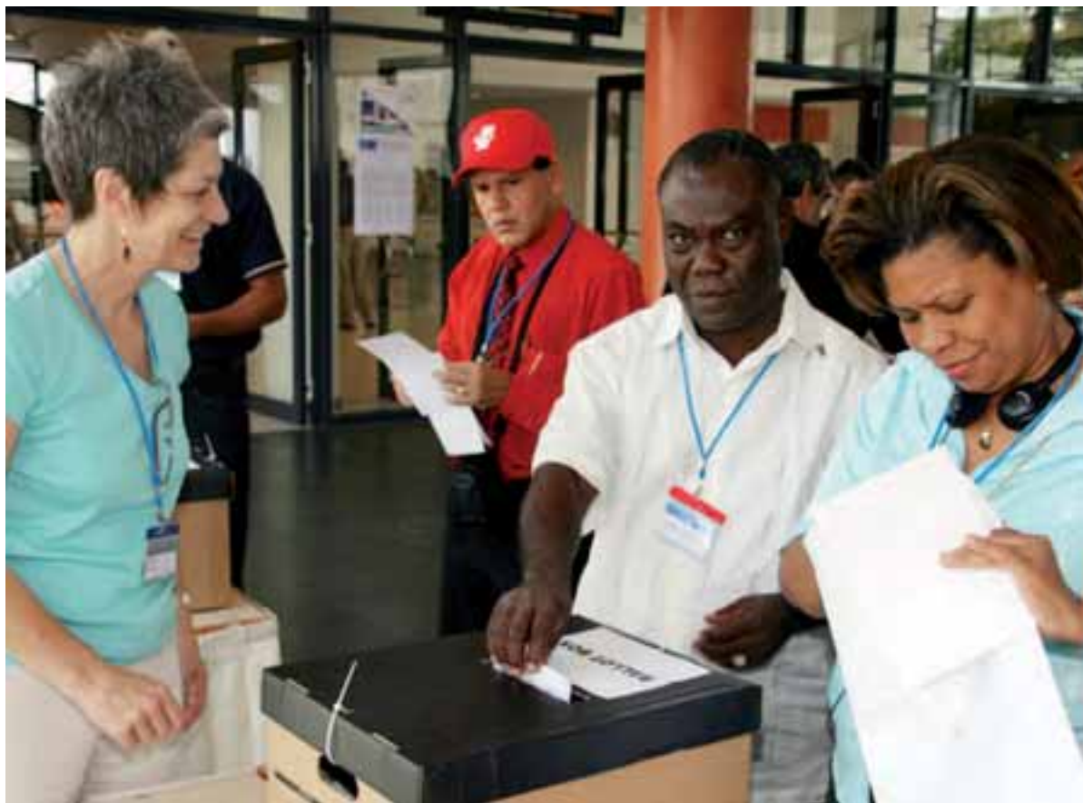
El cinquè congrés de la IE es va celebrar a Berlín en 2007

Tindrà lloc a Sudàfrica del 22 al 26 de juliol i s'hi debatrà sobre estratègies sindicals globals i sobre polítiques integradores en educació