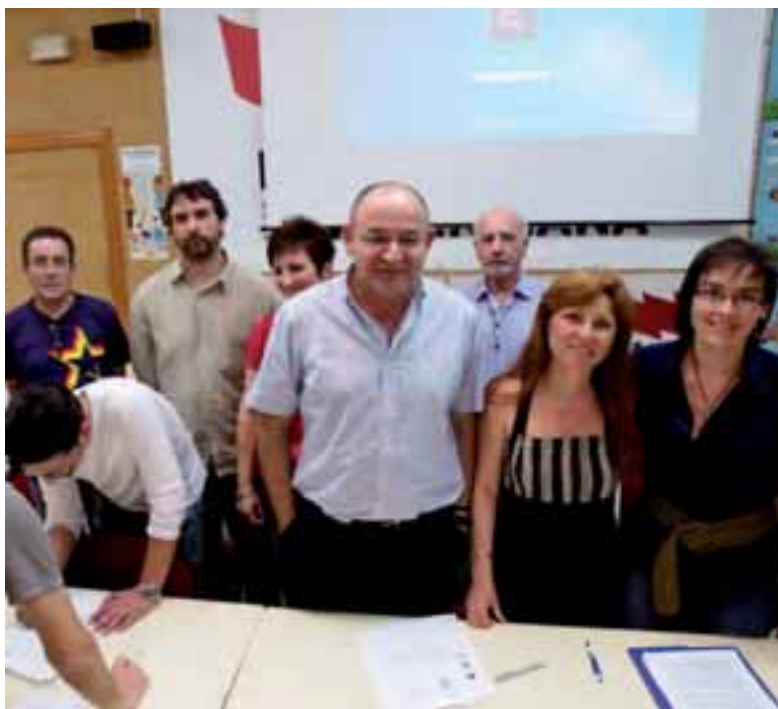
Acte de presentació de la Plataforma a la seu d'STEPV AMADEU SANZ

científic i pedagògics que han avalat, entre d'altres, el 13é Congrés mundial de sexologia o la mateixa conselleria de Sanitat de la Generalitat Valenciana.