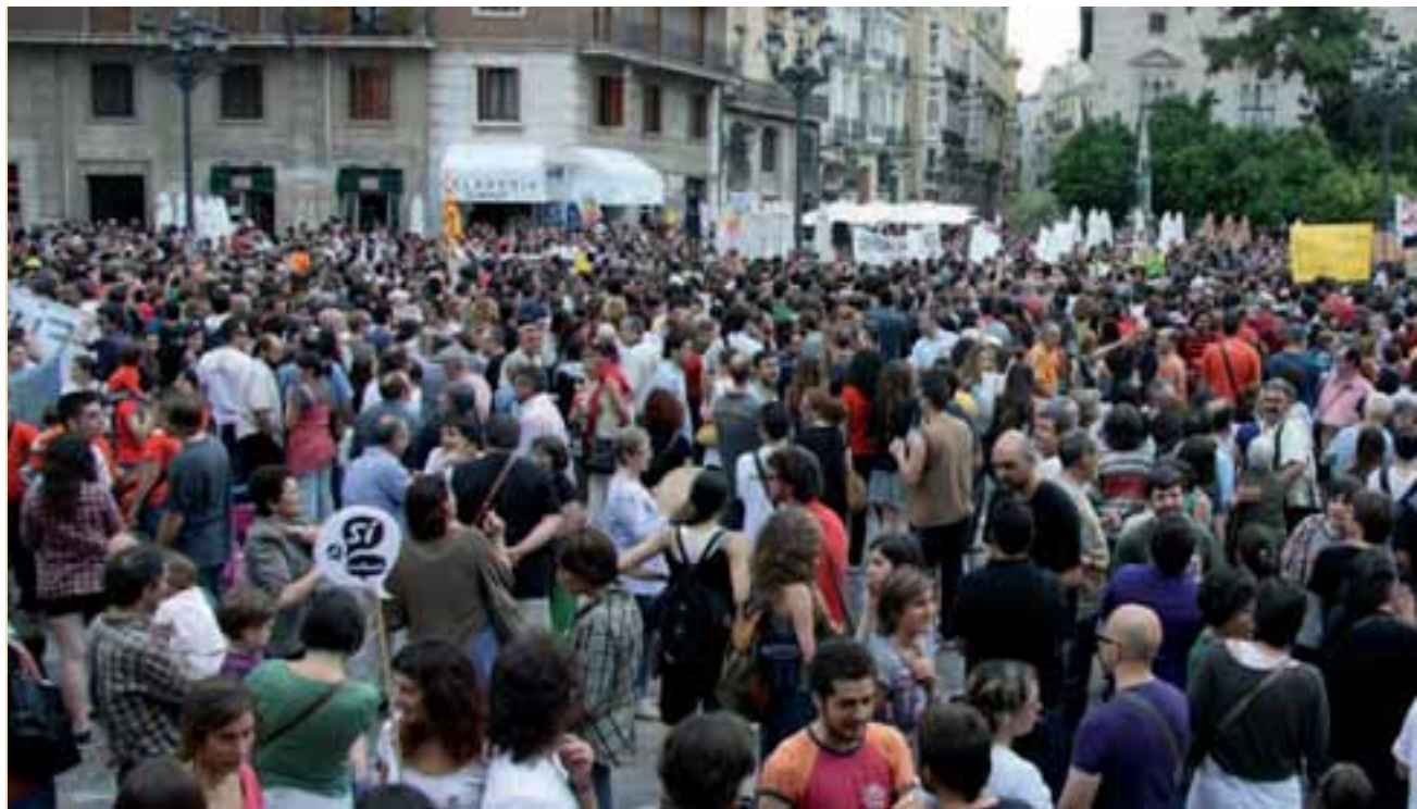
Plaça de la Mare de Déu de València, el 9 de juny