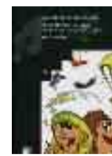
La maleta de la ciència, Enric Ramiro Roca, Graó, Barcelona 2010, 189 pàg.

Per a complementar el llibre i tindre una visió més àmplia de la història del sindicat cal llegir el llibre que va editar la Confederació d'ITES sota el títol 25 anys i més de sindicalisme a l'ensenyament (2003) i l'edició commemorativa de 30 anys de la revista Allioli (2009).