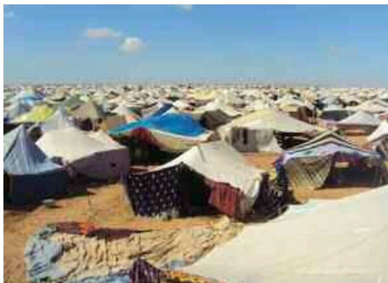
Camament de treballadors de Fos BOU-Craa RESISTÈNCIA SAHARAUI