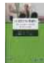
La pizarra digital, Domingo J. Gallego i Nibaldo Gatica (coords.), Eduforma, Sevilla 2010, 114 pàg.

qualsevol edat, des dels més menuts fins els més grans, i que ofereix seixanta pràctiques engrescadores, però senzilles, sobre aire i aigua.