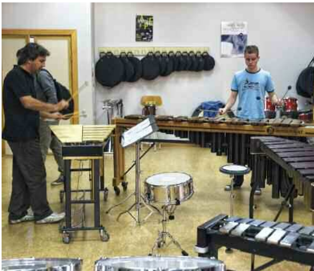
Classe de percussió al Conservatori professional de música de Torrent (Horta sud) ARXIU