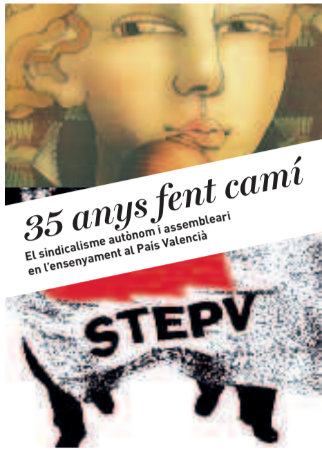
35 anys fent camí. El sindicalisme autònom i assembleari en l'ensenyament al País Valencià, Joan Blanco i Paz (coord.), STEPV-IV, València 2010, 192 pàg.

El llibre és un recull d'articles que situen els fets que han configurat la vida sindical en l'ensenyament des dels anys setanta fins a l'actualitat, tal com han sigut viscuts per una part dels seus protagonistes.