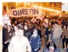
Carrer de la Pau