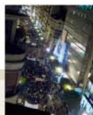
Carrer de Colom