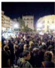
Plaça de la Mare de Déu

29 novembre Desenes de milers de docents, estudiants, pares i mares assisteixen a València, a la manifestació per la millora de l'ensenyament públic.