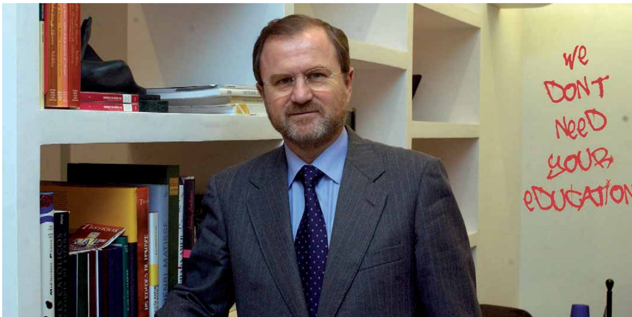
El conseller Font de Mora, al seu despatx