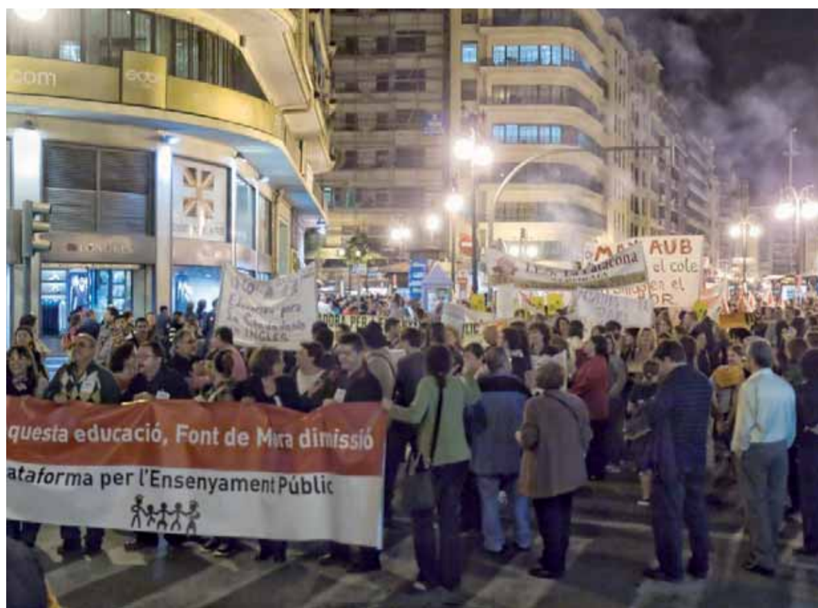
Manifestació del 27 d'octubre a València, contra la política educativa del conseller Font de Mora / A.S.

La comunitat educativa diu prou a tretze anys d'atacs contra l'ensenyament públic