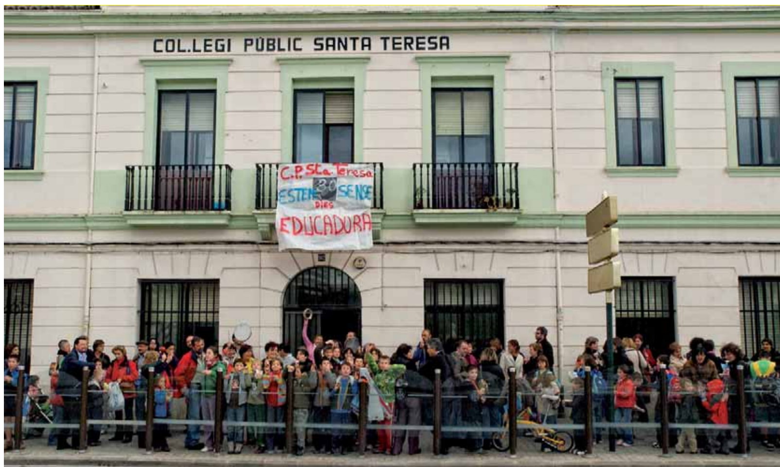
La comunitat escolar del CP Sta. Teresa de València, concentrada el 30 d'octubre en protesta per la falta d'educadors