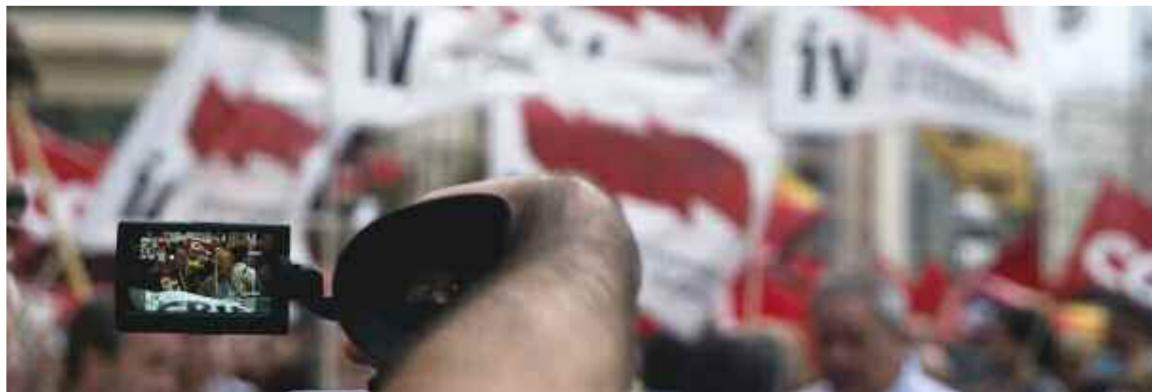
5000 persones es manifesten contra les directives europees i per demanar que la crisi econòmica no la paguen les treballadores i treballador

Intersindical Valenciana no va signar aquest acord de la Mesa General de la Funció Pública.