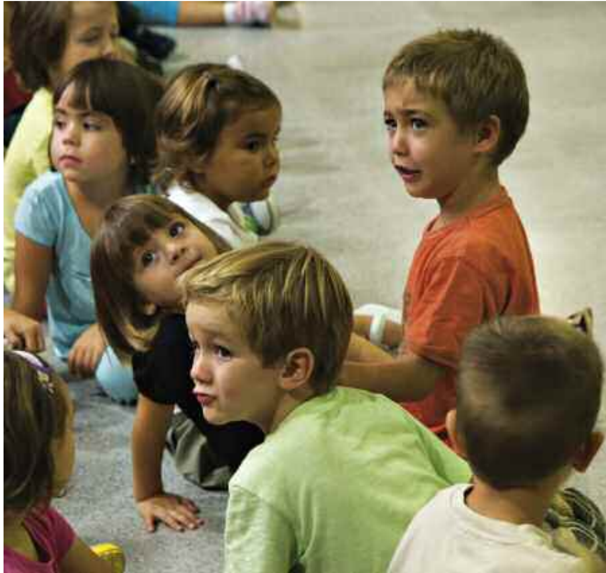
Inici del curs al col·legi públic El Castell, d'Almoines (Safor) / A.S.

El 70% dels centres no imparteixen la llengua estrangera en infantil