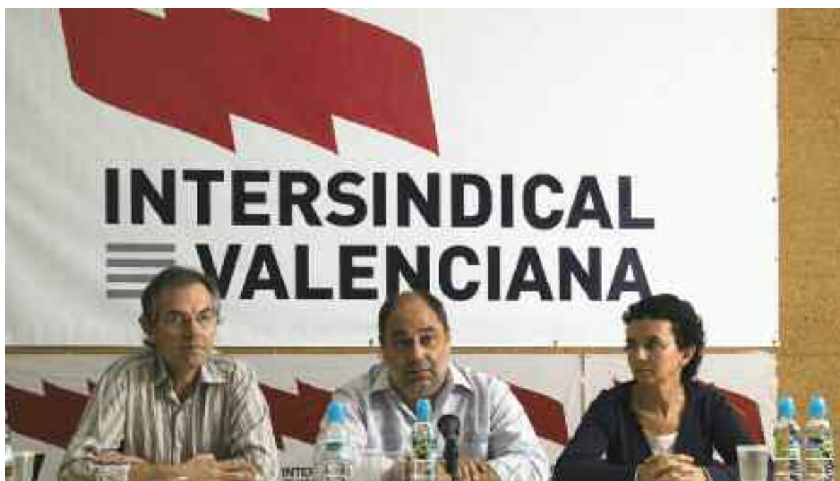
Els representants sindicals, durant la roda de premsa de presentació de manifest a València, el 8 d'octubre

Finalment, USTEC-STES, STEI i STEPV plantegen la necessitat de "desenvolupar les planificacions lingüístiques que s'han revelat arreu del món, en societats plurilingües, com les més adients, i que passen, necessàriament, per la utilització vehicular de la llengua més desfavorida socialment".