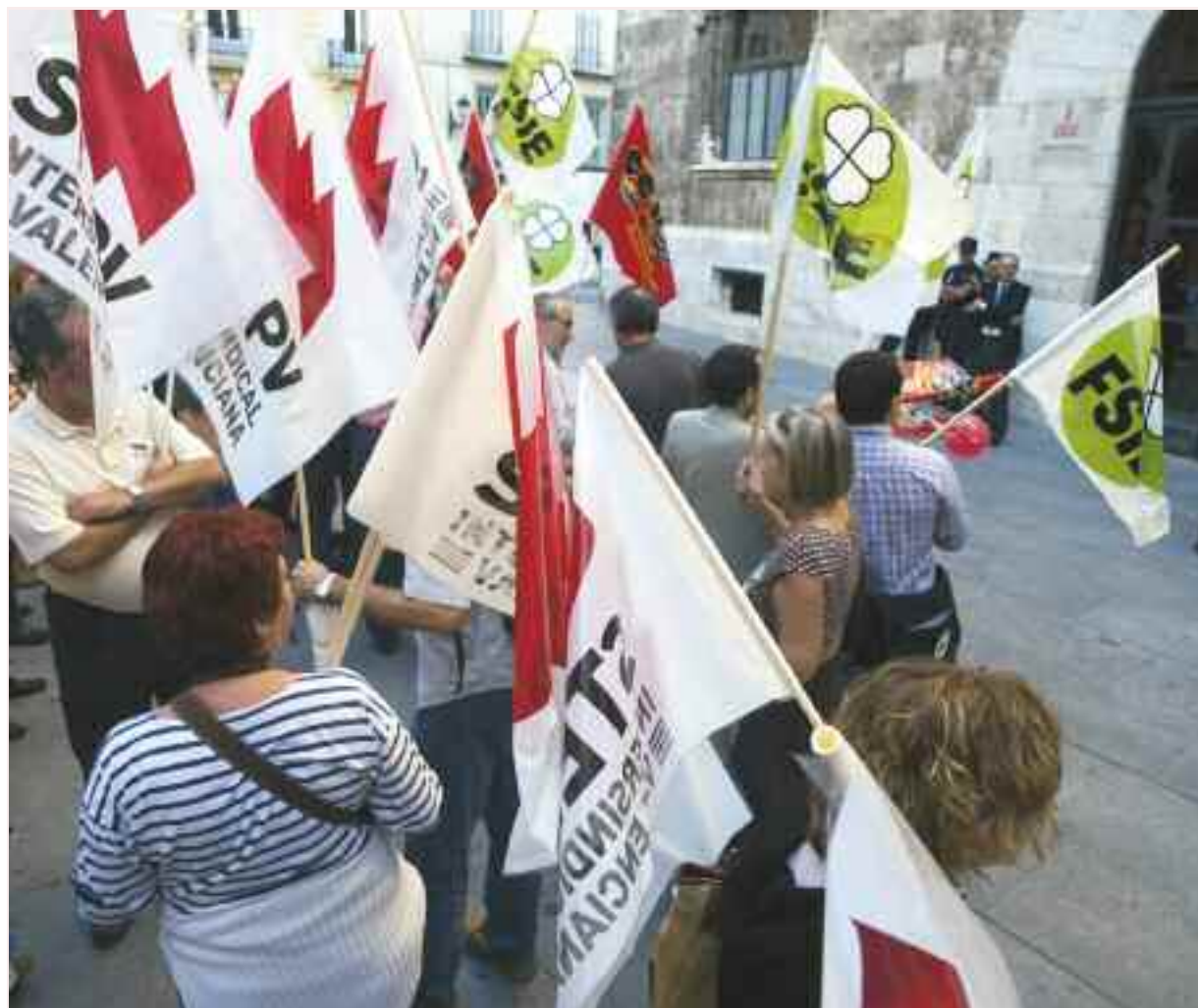
Concentració de professorat de l'ensenyament concertat davant el Palau de la Generalitat, el 6 d'octubre / A.S.

STEPV denuncia el 'menyspreu' de les autoritats envers l'ensenyament concertat