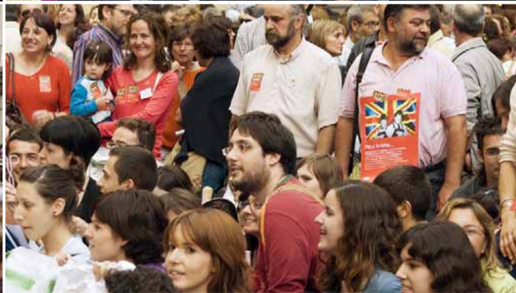
Aspecte de les concentracions de passat 21 de maig, a València i Alacant