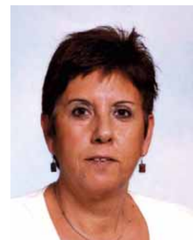
Concha Durán / FOTO: ARXIU