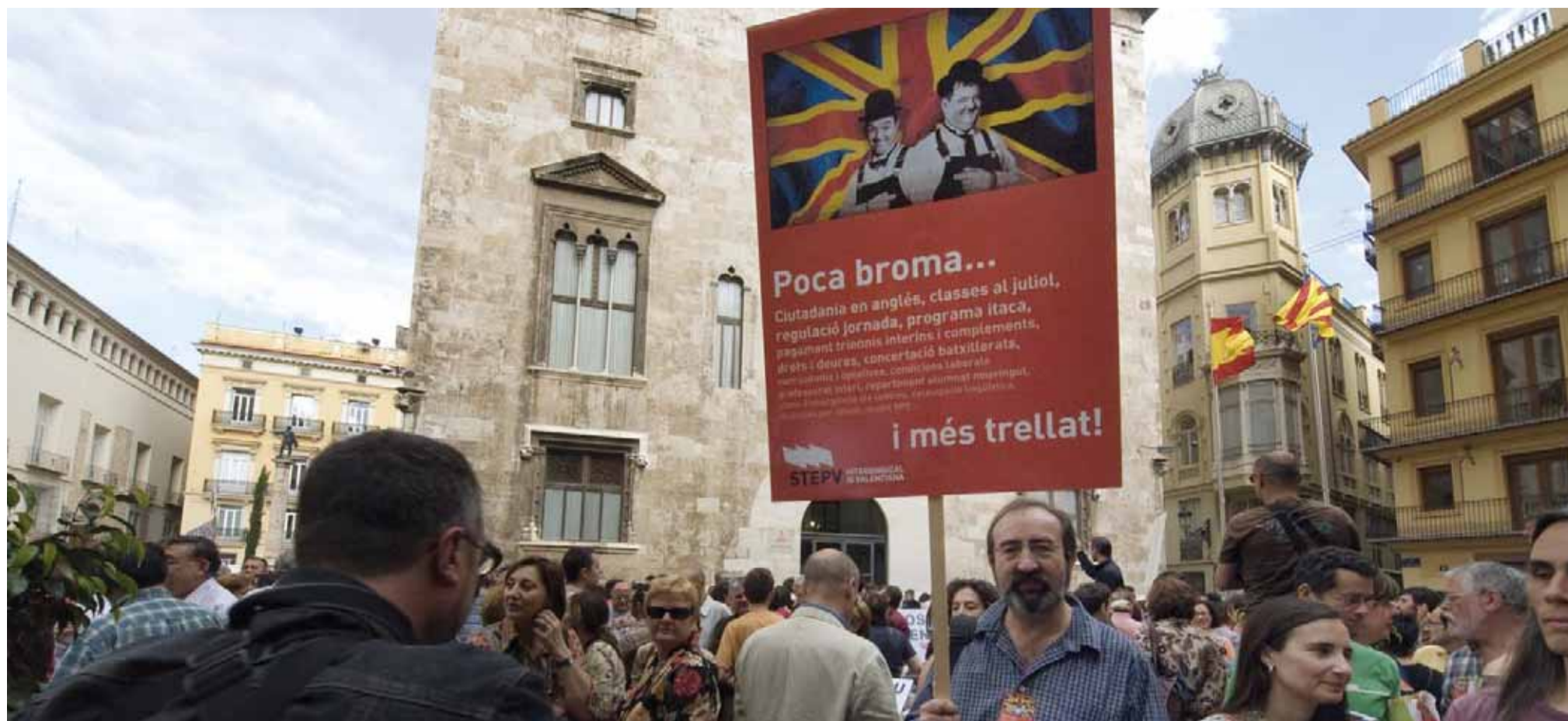
Concentració a València contra la política del conseller, el 21 de maig davant el Palau de la Generalitat

Les protestes del 10 de juny denuncien la negativa del conseller a negociar