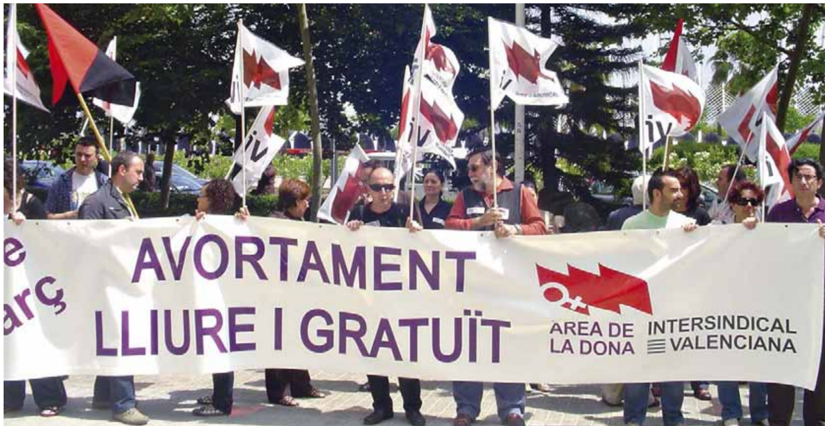
Concentració del 28 de maig

Les jornades també van incloure tallers, entre els quals va destacar el presentat pel col·lectiu Harimaguada, amb un projecte multimèdia dirigit a l'educació afectivosexual, premiat el 2007 pel Ministeri d'Educació.