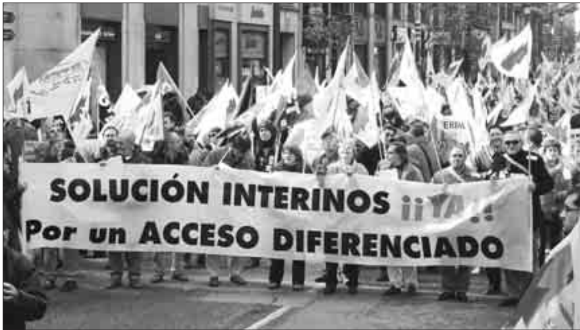
Manifestació dels interins a Madrid el passat 16 de novembre