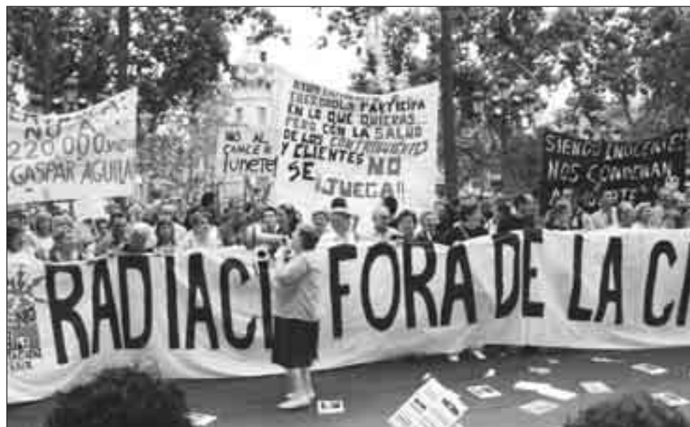
Mobilizacions contra de la subestació elèctrica en Patraix.

En este terreno conviene recordar una grave situación de la que los medios de comunicación se hicieron eco hace apenas cuatro años. Entre el colectivo de 470 niños y niñas del CP García Quintana de Valladolid se llegaron a diagnosticar cuatro casos de cáncer infantil (tres leucemias y un linfoma). La movilización ciudadana consiguió finalmente la retirada de las antenas.