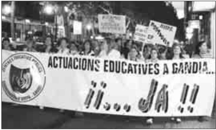
Les associacions de mares i pares es manifestaren a Gandia exigint a la Conselleria d'Educació l'actuació ràpida en les infraestructures educatives de la ciutat, després de la caiguda del sostre de l'IES Ausias March.