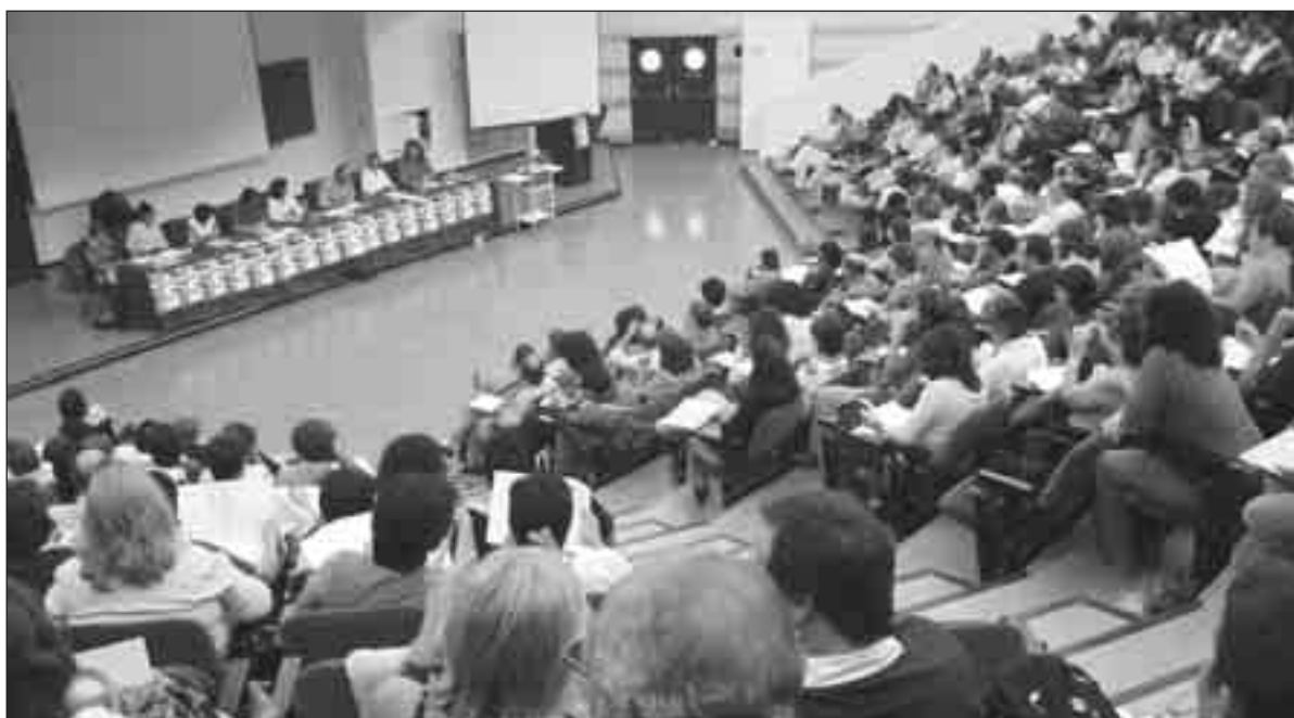
Instantànies de les activitats al Fòrum Social Ibèric celebrat a Còrdova. / J. BLANCO - A. SANSANO