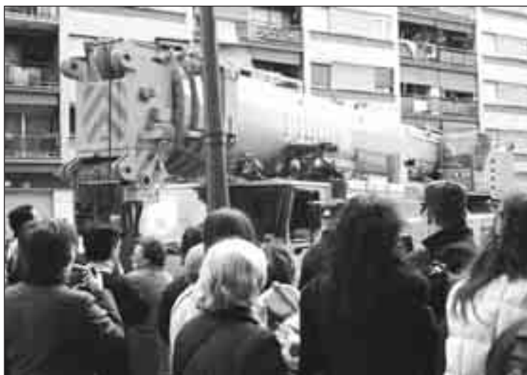
Mobilització al barri de Patraix

La primera manifestació del veïnat de Patraix, l'1 de juny, és un èxit. El moviment comença a créixer: assemblees periòdiques en un parc, soroll de cassoles pels carrers i rotgles de veïns preocupats que conversen i prenen consciència de la situació. De manera espontània veïns i veïnes expressen en el carrer el seu malestar i les seues queixes amb pintades pels murs. L'Ajuntament de