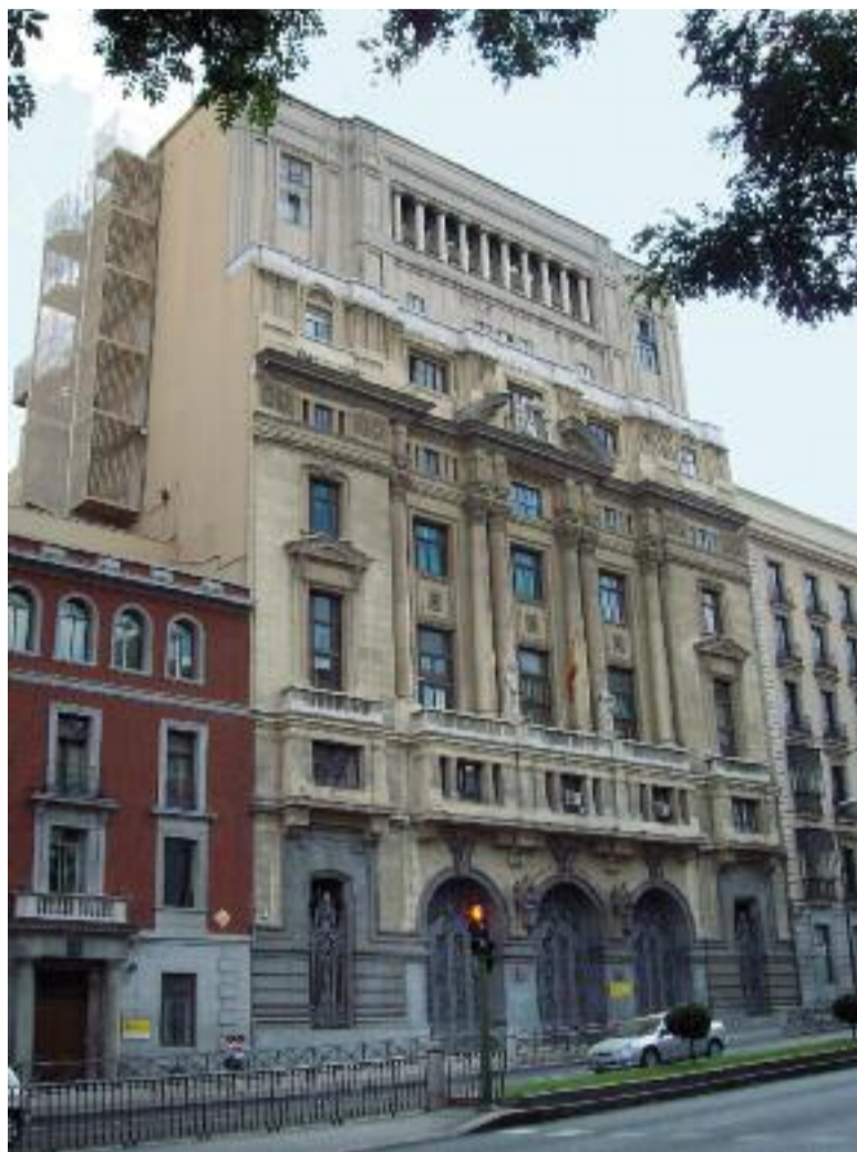
Seu del Ministeri d'Educació a Madrid

'Propuestas para un pacto social y político por la educación'